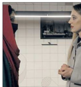
A sinistra, "Disco Afrika" e sopra "My name is Aseman"