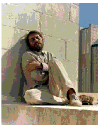
Una scena di L'invenzione di Morel

«Ho letto Borges a diciotto anni e sono stato folgorato, ma è un autore difficile da portare al cinema – disse Greco della genesi di quest'opera – Quando ho letto poi L'invenzione di Morel di Casares vi ho ritrovato la visione del mondo di Borges in una dimensione narrativa e ho colto la sfida».