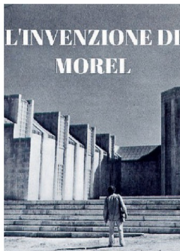
Un film storico «L'invenzione di Morel», dal romanzo di Bioy Casares

Un evaso approda in un'isola deserta, dove scopre un palazzo apparentemente abbandonato, eppure popolato di gente che vi conduce una vita eccentrica e dissipata. Incuriosito e attratto da una delle donne, Faustine, il naufrago cerca di avvicinarsi a lei, ma invano: la donna non mostra di vederlo, è come se egli non esistesse... Il fatto è che 50 anni prima lo scienziato Morel aveva costruito una macchina capace di registrare il tempo. In tal modo ha fissato per l'eternità una settimana di vita di alcuni suoi amici, e quella settimana si ripete perpetuamente. Il naufrago, assuefatto dalla contemplazione, cerca di farsi "registrare", ma ben presto si rende conto che l'immor-