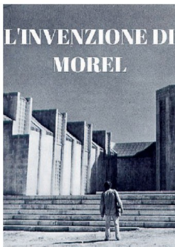
Un film storico «L'invenzione di Morel», dal romanzo di Bioy Casares

Un evaso approda in un'isola deserta, dove scopre un palazzo apparentemente abbandonato, eppure popolato di gente che vi conduce una vita eccentrica e dissipata. Incuriosito e attratto da una delle donne, Faustine, il naufrago cerca di avvicinarsi a lei, ma invano: la donna non mostra di vederlo, è come se egli non esistesse... Il fatto è che 50 anni prima lo scienziato Morel aveva costruito una macchina capace di registrare il tempo. In tal modo ha fissato per l'eternità una settimana di vita di alcuni suoi amici, e quella settimana si ripete perpetuamente. Il naufrago, assuefatto dalla contemplazione, cerca di farsi "registrare", ma ben presto si rende conto che l'immor-