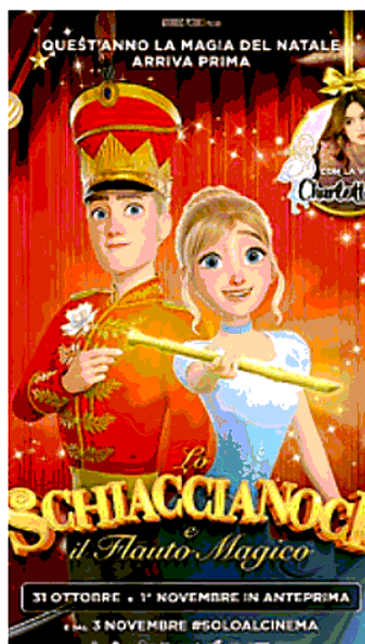
Un cartone da non perdere

Il regista procede per accumulo di situazioni, vuole stupire a tutti i costi, realizza