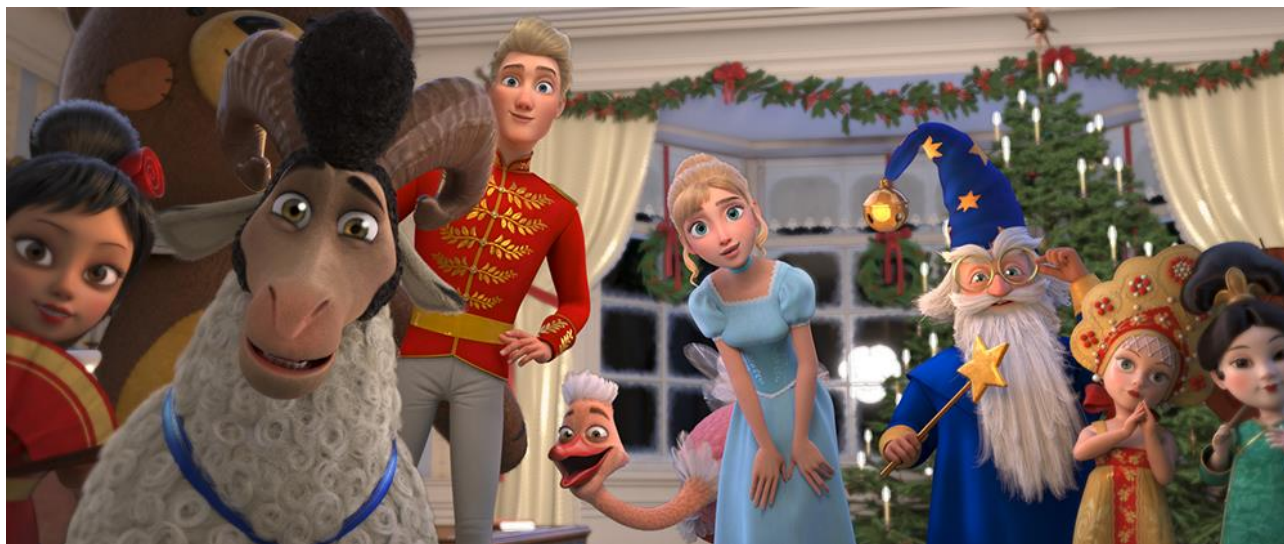
Lo schiaccianoci e il flauto magico

Il 3 novembre torna nelle sale cinematografiche un grande classico, Lo schiaccianoci , tra i capolavori assoluti del teatro ottocentesco. Si tratta, nello specifico, di una nuova versione animata dell'opera, intitolata Lo schiaccianoci e il flauto magico , con la voce della famosissima e talentuosa youtuber e tiktok er Charlotte M.; diretta da Viktor Glukhusin, la pellicola è distribuita da Notorious Pictures .