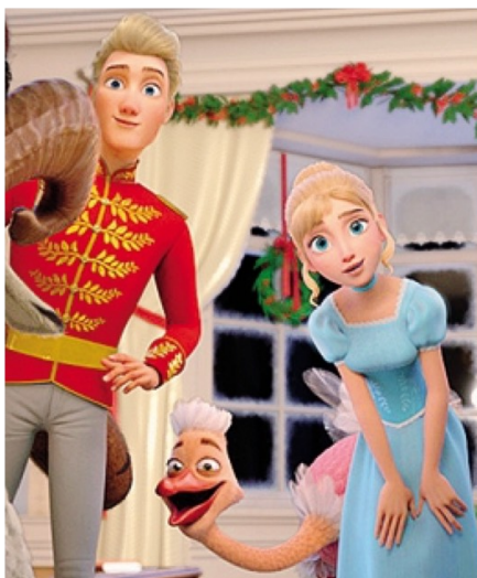
Il film «Lo schiaccianoci e il flauto magico»

Pur di spezzare l'incantesimo e tornare alla situazione precedente, la protagonista accetta di seguire il principe dentro la tana dei ratti in compagnia di Ricciolo, un ariete spaccone, e Becco rosso, lo struzzo fifone. Un gruppo improbabile che dovrà affrontare i roditori che, al seguito