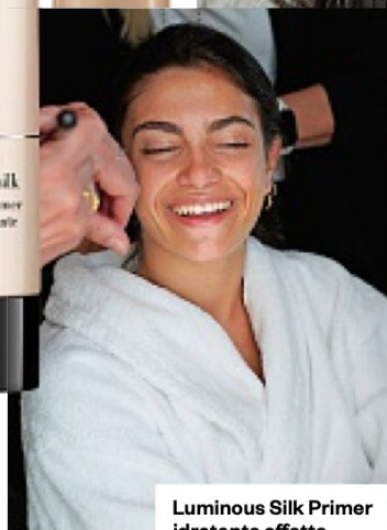
Luminous Silk Primer idratante effetto radioso (48 euro).