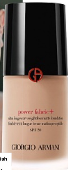
Power Fabric+, fondotinta dal finish mat naturale, ad alta coprenza eppure impalpabile, con pigmenti tech e durata 24 ore (52 euro).