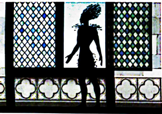
ALICE NELLA CITTÀ. THE BLACK PHARAOH, THE SAVAGE AND THE PRINCESS (Francia, 2022), animazione di Michel Ocelot.

Favole per ragazze che non piangono. Favole nere, favole rosa, favole d'avventura e di coraggio. Tre fiabe in una, come nel cartone animato del maestro francese dell'animazione Michel Ocelot (il papà di Kirikù e la strega Karabà) che porta ad Alice il suo The Black Pharaoh, the