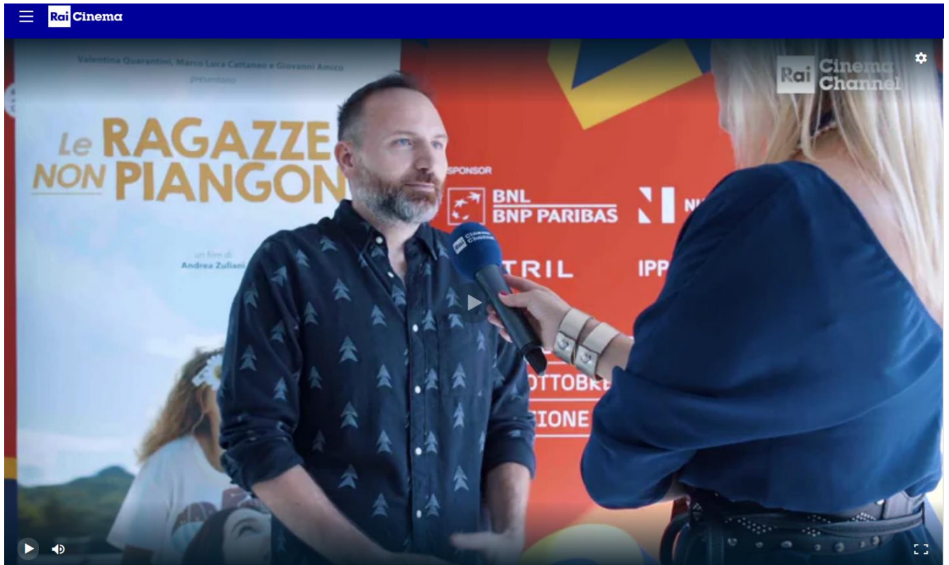
Roma 2022 - "Le ragazze non piangono" - Interviste