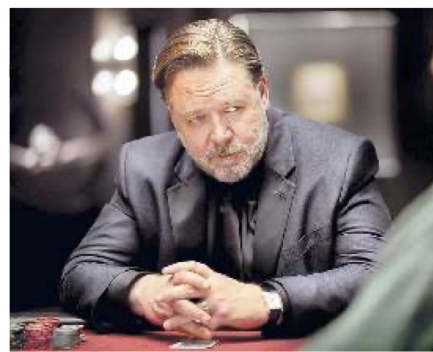
L'attore neozelandese Russell Crowe, 58 anni, in "Poker Face"

anni in una scuola elementare di Roma e in programma stamattina insieme al film evento Il ragazzo e la tigre di Brando Quilici. Molti nel programma i film sul tema dell'adolescenza ( La Maternal , Before I Change My Mind , Les Pires , Close , Armageddon Time ) e sulla famiglia ( I love my dad , Cet Été-Là , Signs Of Love , Summer Scars , Hawa ). Quattro i film fuori concorso, una serie tv (il thriller Paramount + sulla ginnastica artistica, Corpo Libero ) e 8 film nella sezione Panorama Italia, tra horror ( Piave ) e road movie ( Le ragazze non pianono ), musical ( My Soul Summer ), The land of dreams ), thriller ( L'uomo sulla strada ), fantasy ( I viaggiatori ), dramma ( Primo piano , Primadonna , Il ritorno e I nostri eroi )