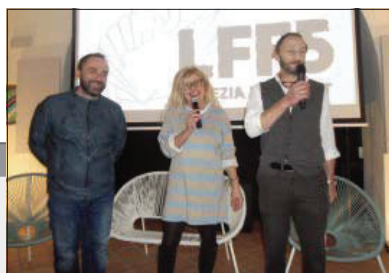
L'incontro con gli studenti

ELISABETTA e Piero Villaggio al loro arrivo all'ultima giornata del Lamezia Film Fest