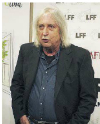
Enrico Vanzina Ha ufficialmente aperto la quinta edizione del Lamezia Film Fest

La quinta edizione del LFF5 si svolge in una città, Lamezia appunto, che