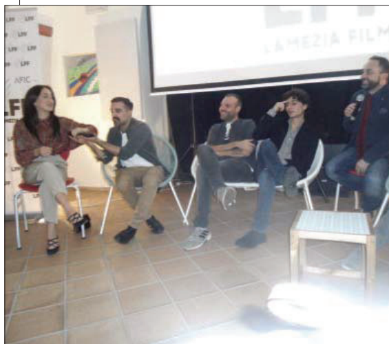
Il dibattito con Casa Surace