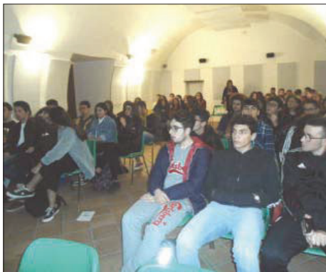
Gli studenti assistono alla proiezione del film

Quasi 100 studenti, delle classi quarte del Liceo scientifico "Galileo Galilei" di Lamezia Terme, hanno assistito alla proiezione del film "Sulla mia pelle" in assoluto silenzio dimostrando grande interesse per un fatto di cronaca, accaduto nella fatidica notte del 15 ottobre del 2009 e riguardante un giovane di 31 anni, Stefano Cucchi, arrestato per detenzione e spaccio di sostanze stupefacenti. Muore il 22 ottobre nel reparto protetto dell'ospedale romano Sandro Pertini in una assordante solitudine e senza il sostegno della