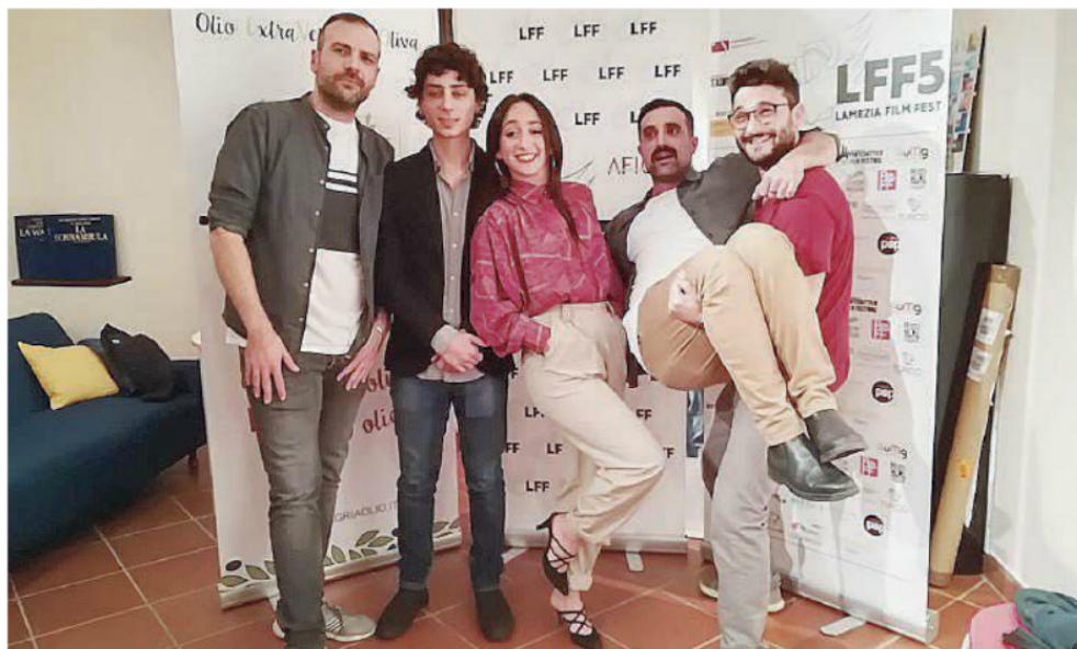
Quelli di "Casa Surace" Un gruppo da record: 400 milioni di visualizzazioni, 2 milioni di social fan