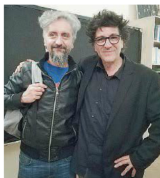
Ospiti di genio Ascanio Celestini e Daniele Cipri